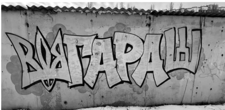
Prieš metus žuvusiam Tadiui Tumui, kovine pravarde „Gara“, skirtas grafitis.

Grafitis puikuoja ant mūro sienos šalia kitų piešinių, skirtų pagerbti karių bei karinius dalinius. Už minėtos mūro sienos stovi sudegę garažai bei namai su skylėmis vietoje kai kurių langų, nes nukentėjo per priešų bombardavimus.