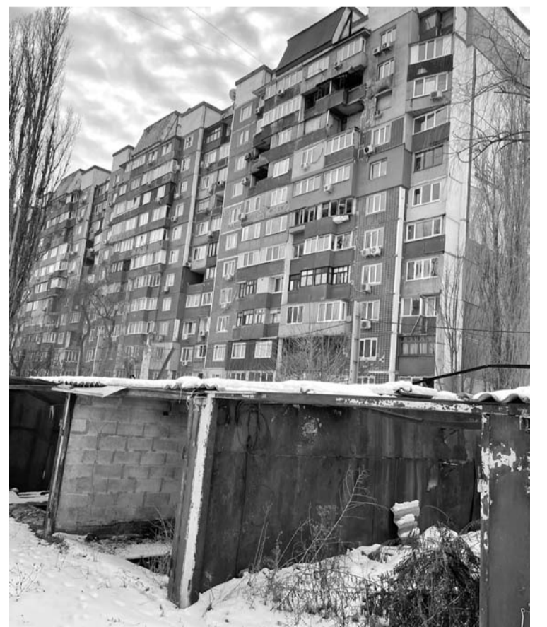
Už grafičio yra sudegę garažai ir bombų apgadinti namai.