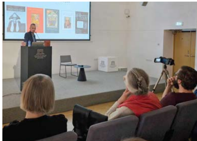
Paskaitų ciklo „Slaptieji tekstai“ paskaita nacionalinėje Martyno Mažvydo bibliotekoje 2024 metų rugsėjo 19 dieną.