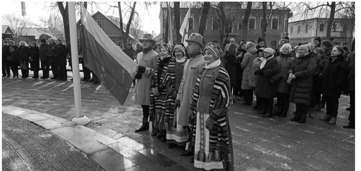
Pagrindinis valstybinių švenčių akcentas – Lietuvos Respublikos vėliavos pakėlimas.

Šiam faktui dar nepaaiškėjus, „Anykšta“ teiravosi pašnekovų nuomonės, kaip jie vertina tai, jog poilsio dieną valstybinėje šventėje dalyvavusiam valdžios atstovui buvo mokamas dvigubas atlyginimas.