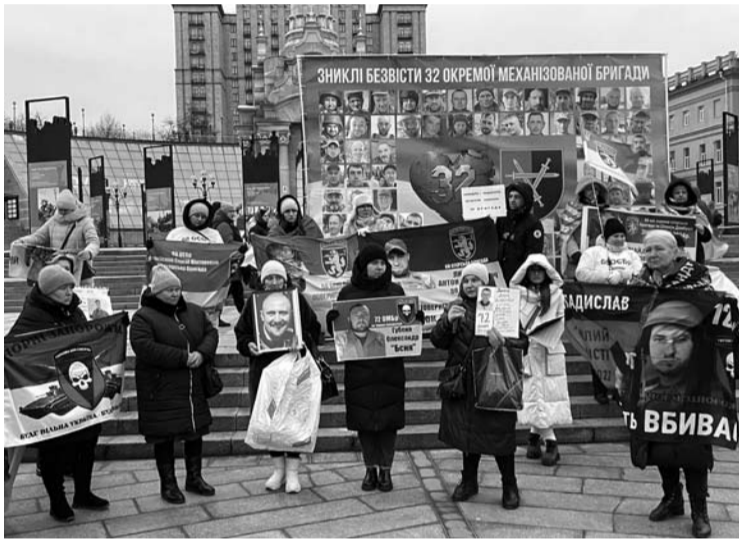
Rusų nelaisvėn patekusių karių artimieji prašo juos išvaduoti.

Apie tai, kokiomis nuotaikomis charkiviečiai pasitinka ketvirtus karo metus, nusprendžiau praeivių gatvėje paklausinti, pasiėmęs į ranką ryškų mikrofoną. Mat vietiniai bijo atvirauti dėl draudimo viešinti strateginius objektus, žuvusių bei sužeistų karių kiekį ir dėl įsivyravusio nepatiklumo. Prisistačius, kad esu karinę akreditaciją turintis lietuvis, ir darau įrašą neklausdamas pavardės bei nefotografuodamas pašnekovo, atsiranda gerokai didesnė tikimybė, kad išgirsiu tikrą nuomonę.