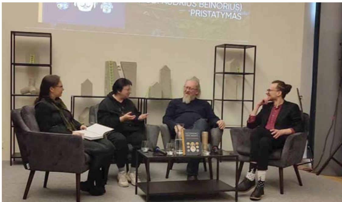
Knygos „Ezoterizmo fenomenas tarp Rytų ir Vakarų“ pristatymas Klaipėdos apskrities I. Simonaitytės viešojoje bibliotekoje 2024 metų balandžio 20 dieną.